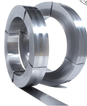
Kaltgewalzter Bandstahl für Steingattersägen Cold rolled strip for gang saw blades