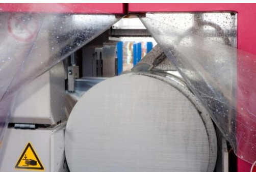
Rundstäbe und gesägte Stäbe Round bars and cut pieces

Alle Angaben in dieser Broschüre ohne Gewähr und vorbehaltlich Änderungen. Internationale und deutsche Standards können in der Analyse abweichen.