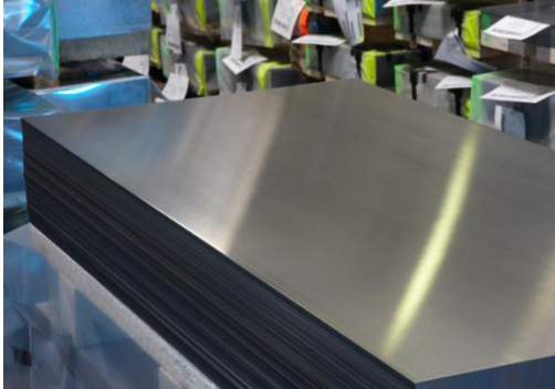
Kaltgewalzter Bandstahl, vergütet Cold rolled strip, bright hardened and tempered