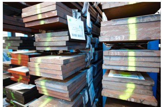
Flachstäbe Flat bars