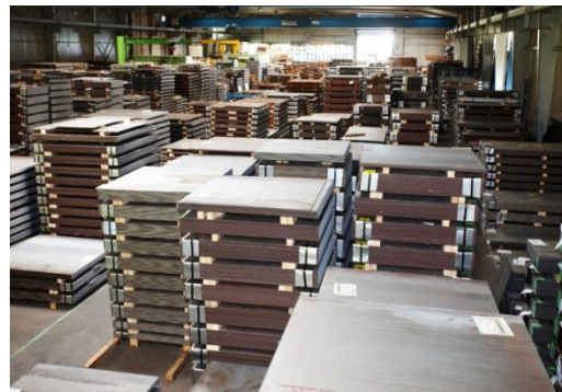
Warmgewalzter Bandstahl Hot rolled strip